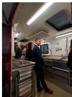
Sachsens Ministerpräsident Michael Kretschmer im Notfallcontainer Kulturgutschutz des Notfallverbands Köln