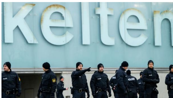
Vor dem Museum, Foto: Lennart Preiss/dpa

Fast 500 Keltenmünzen und einen Goldklumpen stahlen Unbekannte am 22. November aus dem Kelten-Römer-Museum im oberbayerischen Manching. Sie hebelten eine Fluchttür auf und kappten die Glasfaserkabel der Telekom und damit die Verbindung der Alarmanlage zur Polizei. Neun Minuten brauchten sie, um zwei Panzerglasvitrinen zu zertrümmern und zu verschwinden. Das Vorgehen erinnert an den Einbruch ins Grüne Gewölbe in Dresden im Jahr 2019. Auch im Rheinischen Landesmuseum in Trier versuchten Einbrecher 2019 den Goldschatz zu stehlen. Dies misslang jedoch, weil den Tätern Zeit fehlte. Inzwischen gibt es in Trier eine Notfallkommunikation, die unabhängig von Glasfaserkabeln funktioniert. Wie das geht, wird lieber nicht mitgeteilt. Am Wochenende des vierten Advents wurde bekannt, dass ein Großteil der Beute an das Grüne Gewölbe in Dresden zurückgegeben wird.