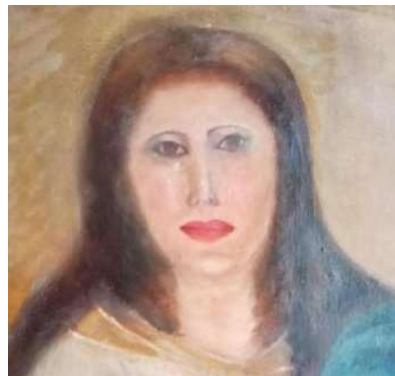
Originalzustand (Ausschnitt) und nach der „Restaurierung“ (Ausschnitt), Fotos: Europa Press

Ähnliches geschah bereits 2012, ebenfalls in Spanien. Das kaputtrestaurierte Fresko „Ecce homo“ ist inzwischen ein Publikumsmagnet.